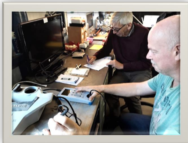
Keurmeesters in actie