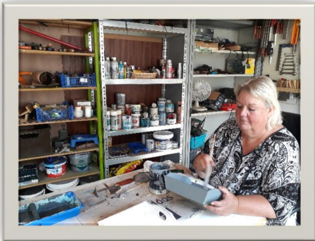
Meubels en kleine voorwerpen pimpen

Bij elke aanmelding werd gekeken of er passende werkzaamheden voor de cliënt zijn en of de cliënt binnen de organisatie past, zodat de cliënt tot zijn recht komt en zich op zijn gemak voelt.